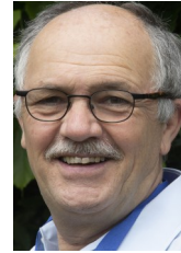
LAURENS VERHEGGEN Foto's